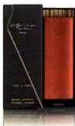
Encens Christian Tortu MADE IN PARIS