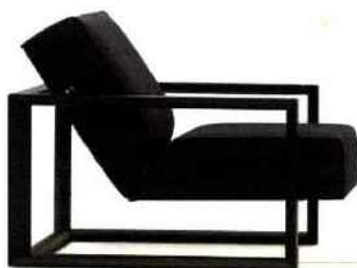
Fauteuil Dickens MONTIS