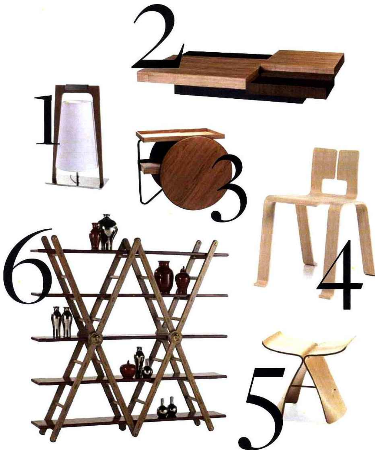
1. Lampe Arche à poser en métal et bois, Les Héritiers • 2. Table basse Décalo, Roche Bobois • 3. Chariot GamFratesi, Casamania • 4. Chaise en chêne Ombra Tokyo de Charlotte Perriand, Collection Cassina I Maestri • 5. Tabouret Butterfly Stool sori Yanagi, 1954, chez Vitra • 6. Bibliothèque échelle Correspondances, Roche Bobois