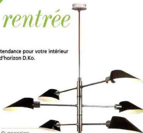
Suspension LAURIE LUMIERE