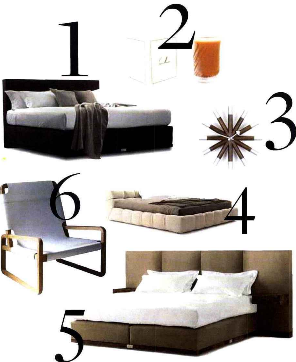
1. Lit + tête de lit en novasuède Base du lit en wengé, Savoir Beds • 2. Bougie chateau Marmont, Colette • 3. Horloge Wheel clock George Nelson, Vitra • 4. Lit, B&B Italia • 5. Lit + tête de lit et sommier tapissé de suédine taupe. Base et tables de chevet en ronce de noyer, Savoir Beds • 6. Fauteuil Zeffirelli chêne et cuir, Ochre