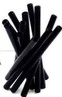
Lampe B&B ITALIA