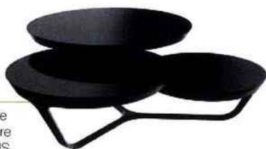
By ORA ITO une table basse noire ROCHE BOBOIS

E nvie de changer de décor ? Alors faites le plein d'idées tendance pour votre intérieur et pour une rentrée inspirée, en découvrant notre tour d'horizon D.Ko.