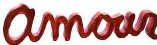
"Amour" de Ben pour DAUM