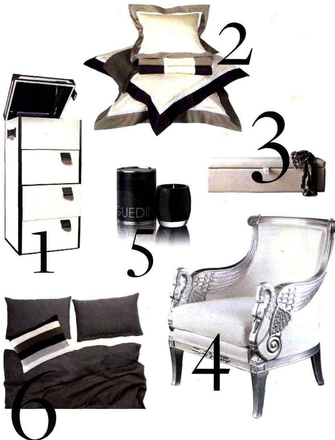
1. Treasure Booty kit, Collection Zoeppritz • 2. Parure de lit Berlingot, Maison Noël • 3. Coffre Chest, structure en bois et cuir ou nubuck, Ochre • 4. Bergère cygne, BALCAEN • 5. Bougie Marianne Guedin, Made in Paris • 6. Bed Stay 970 Holy, Zoeppritz