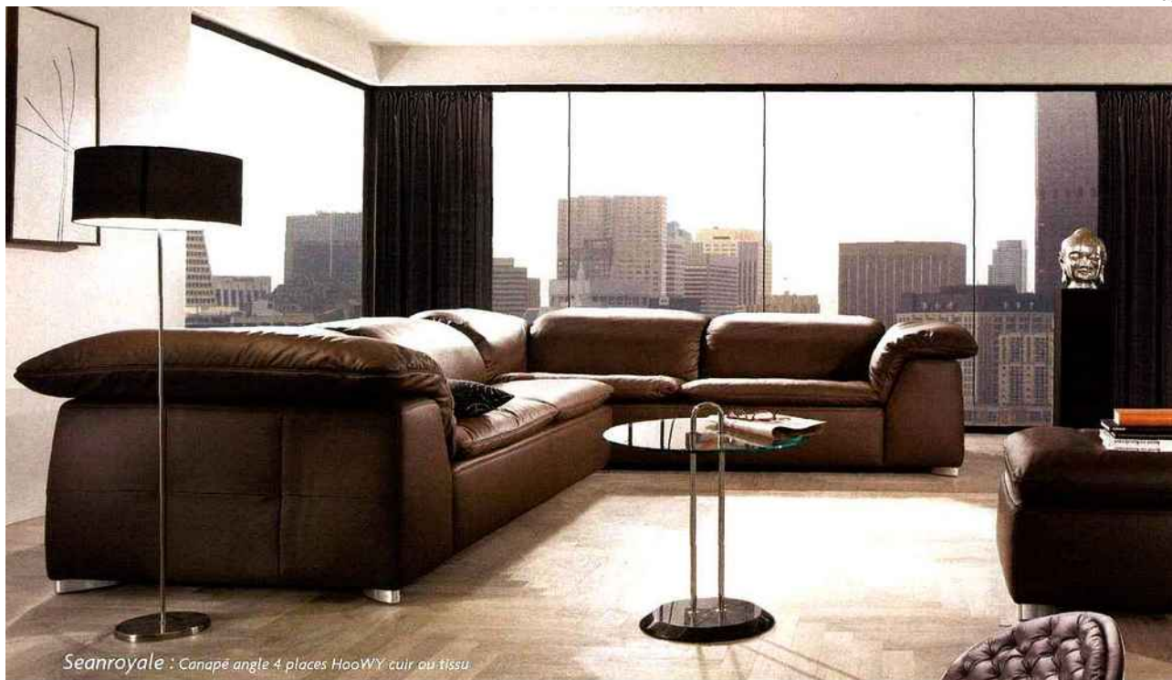
Seanroyale : Canapé angle 4 places HooWY cuir ou tissu

Pour tous ceux qui apprécient la perfection des lignes et le confort esthétique, Seanroyale vous offre le nec plus ultra dans le domaine des canapés.