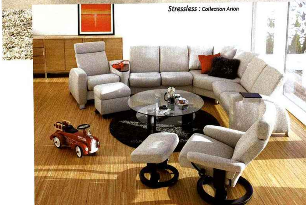
Stressless : Collection Arion