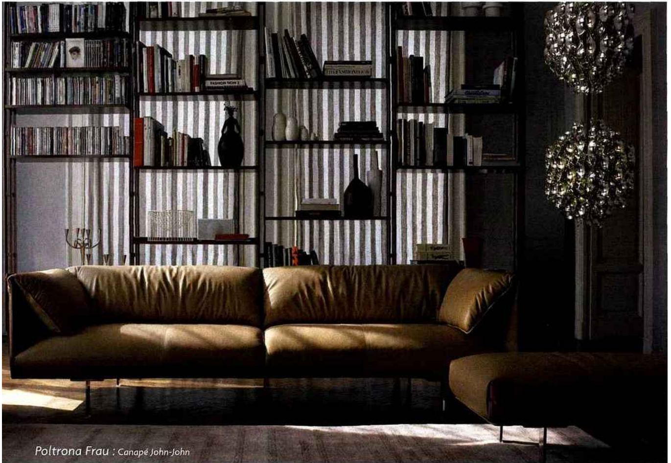
Poltrona Frau : Canapé John-John