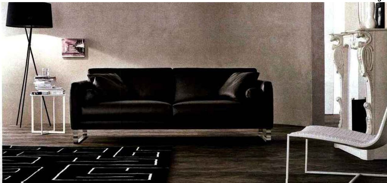
Alivar : Canapé Dover