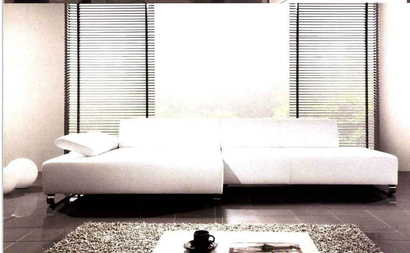
Seanrovale : Canapé Admiral