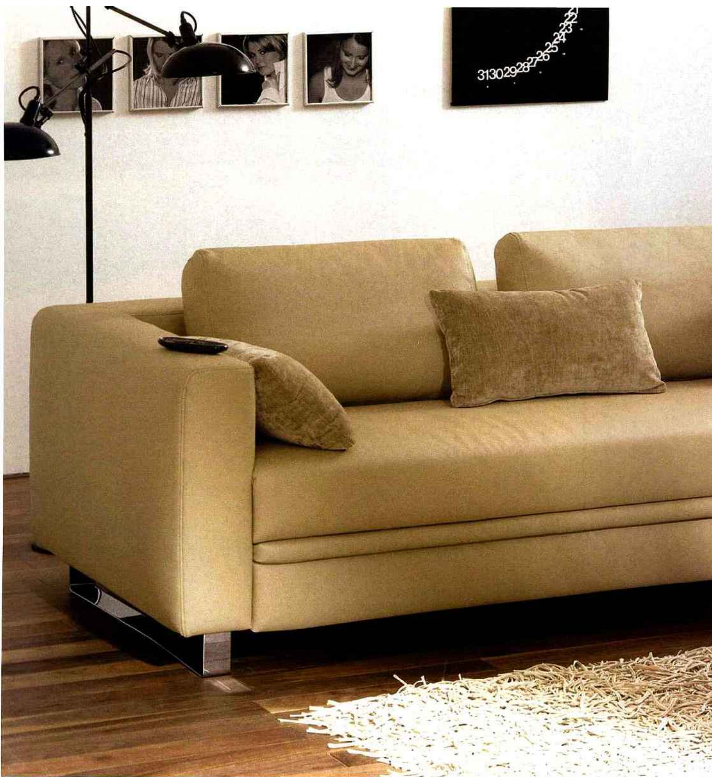
Hülsta : Canapé lit en simili cuir sable