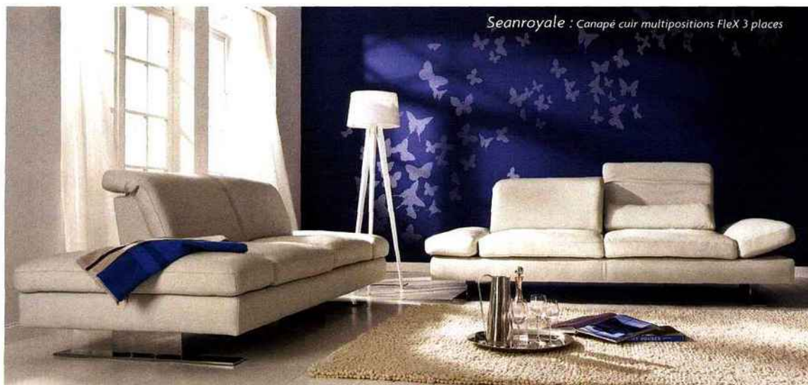
Seanroyale : Canapé cuir multipositions Flex 3 places