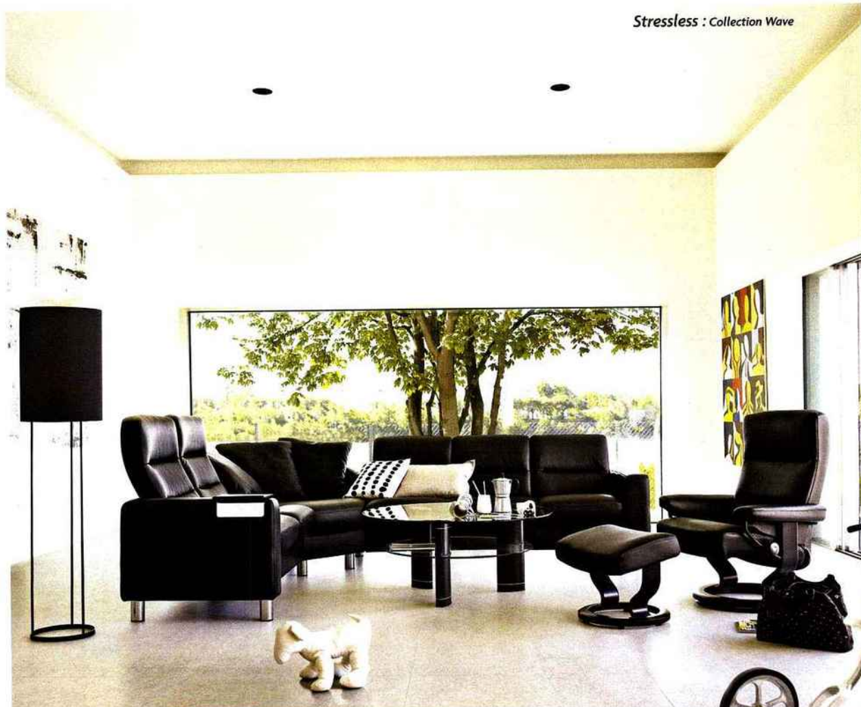
Stressless : Collection Wave