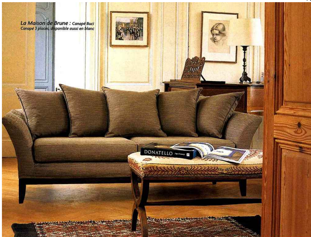
La Maison de Brune : Canapé Buci Canapé 3 places, disponible aussi en blanc