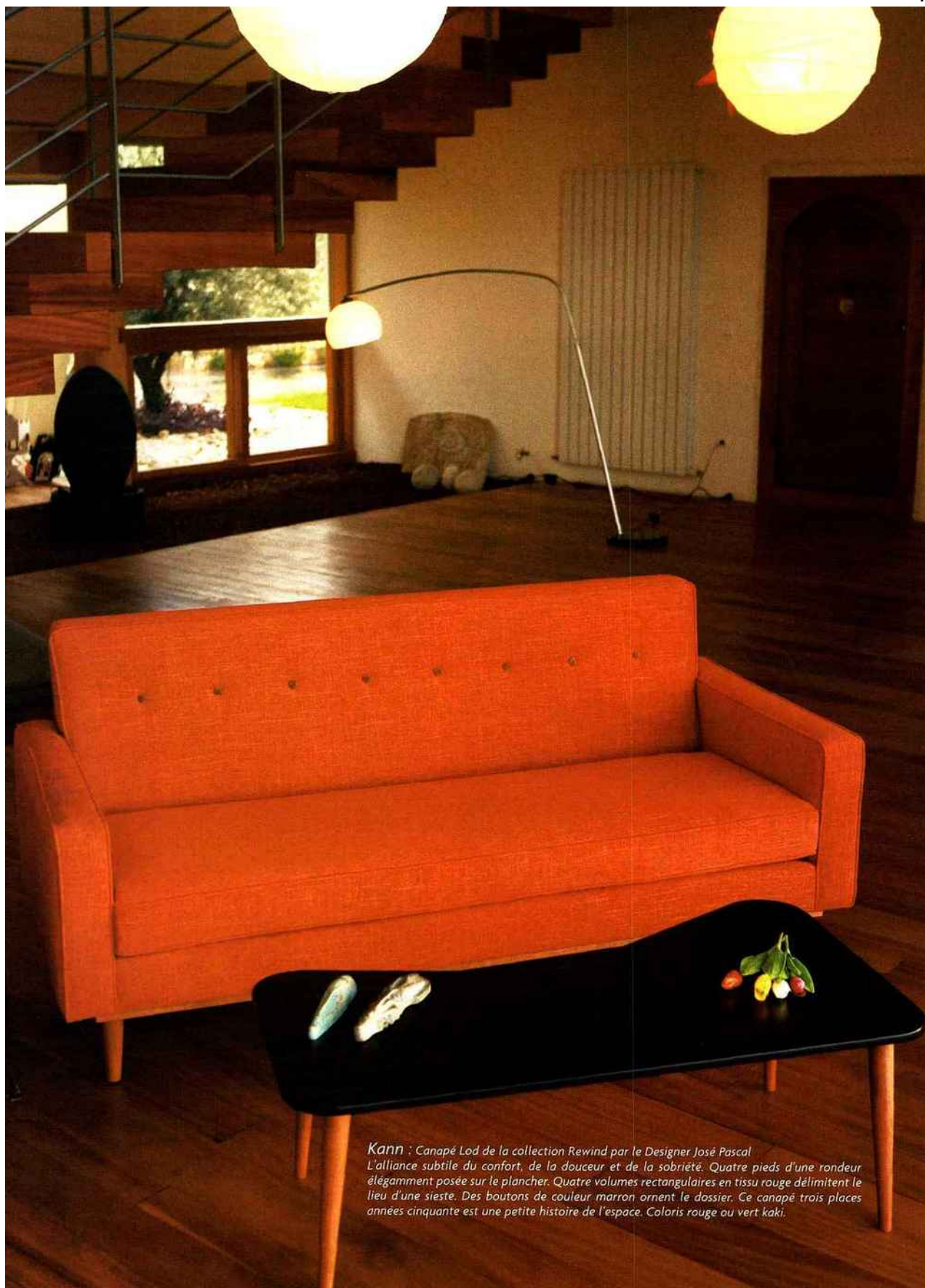
Kann : Canapé Lod de la collection Rewind par le Designer José Pascal L'alliance subtile du confort, de la douceur et de la sobriété. Quatre pieds d'une rondeur élégamment posée sur le plancher. Quatre volumes rectangulaires en tissu rouge délimitent le lieu d'une sieste. Des boutons de couleur marron ornent le dossier. Ce canapé trois places années cinquante est une petite histoire de l'espace. Coloris rouge ou vert kaki.