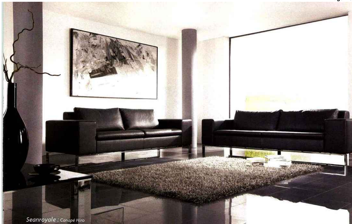
Seanroyale : Canapé Hiro