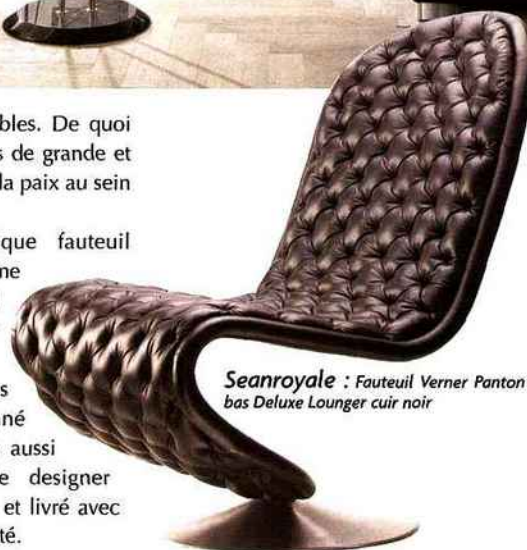
Seanroyale : Fauteuil Verner Panton bas Deluxe Lounger cuir noir

Egalement ce magnifique fauteuil lounge, issu de la gamme system 1-2-3. Ce fauteuil bas est proposé en cuir semi aniline Savane noir, avec d'autres couleurs disponibles et capitonné façon Chesterfield, mais aussi en tissu. Créé par le designer mythique Verner Panton, et livré avec son certificat d'authenticité.