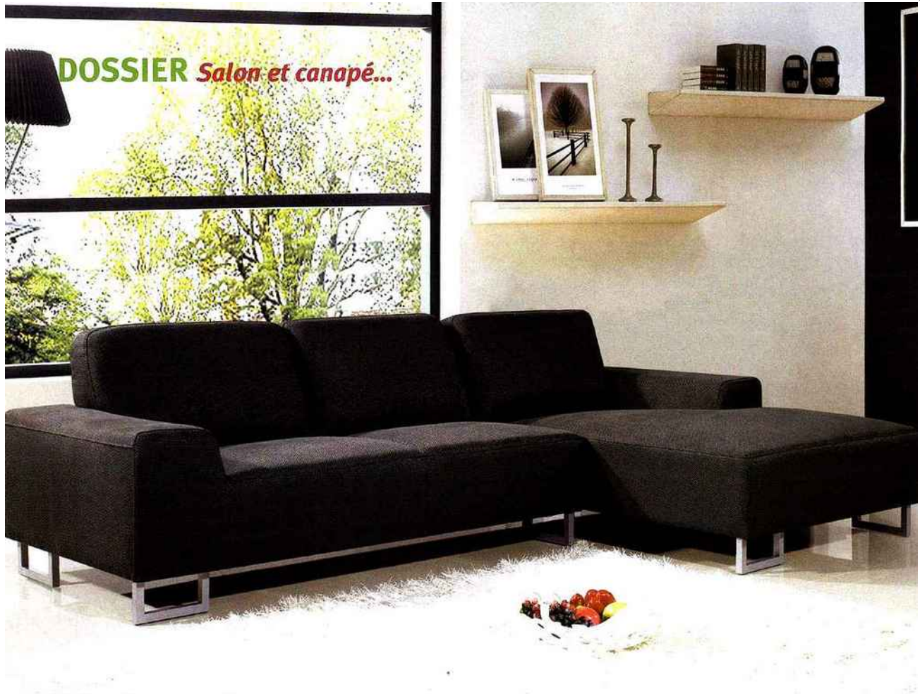
Vente-unique.com : Modèle Arturo Salon d'angle en tissu disponible en gris ou noir

Enfin optez une déco qui affirme votre personnalité, n'hésitez pas à exposer des photos qui vous tiennent à cœur à l'aide de beaux encadrements, de tryptiques, de panneaux méli-mélo. Mettez en valeur et misez budgétairement la priorité sur tel ou tel mobilier en fonction de votre mode de vie. Si vous recevez beaucoup, faites vous plaisir en achetant une immense table et de belles chaises. Si vous êtes plus apéro dînatoire entre amis, optez pour une table basse pouvant s'allonger avec un grand canapé et plein de poufs. Si votre salon est la pièce principale, à la fois cuisine, plateau télé, et chambre, optez pour un canapé convertible de qualité, une petite table basse avec des éléments qui se superposent ou s'emboîtent, un écran plat accroché au mur, sans meuble de TV.