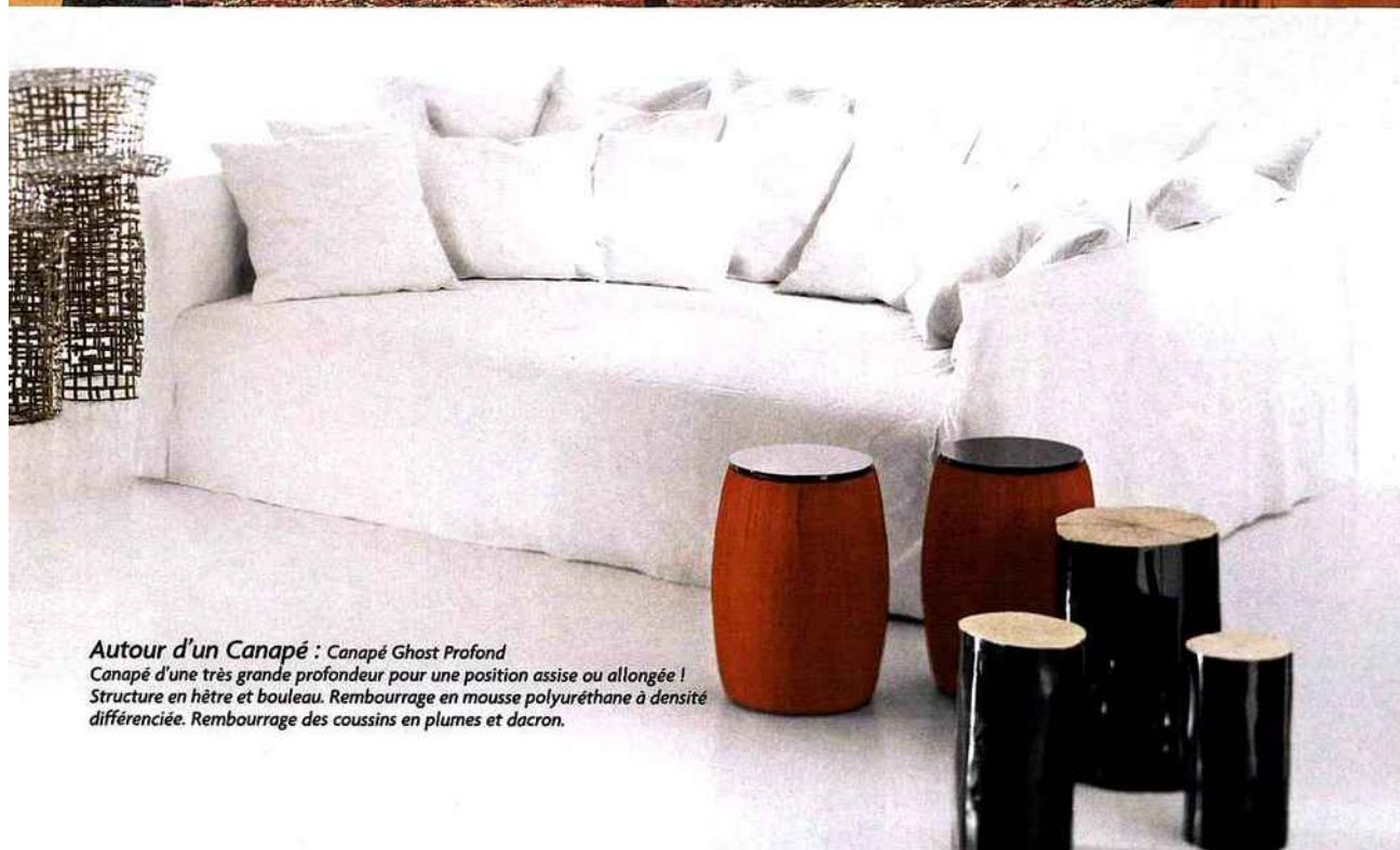
Autour d'un Canapé : Canapé Ghost Profond Canapé d'une très grande profondeur pour une position assise ou allongée ! Structure en hêtre et bouleau. Rembourrage en mousse polyuréthane à densité différenciée. Rembourrage des coussins en plumes et dacron.